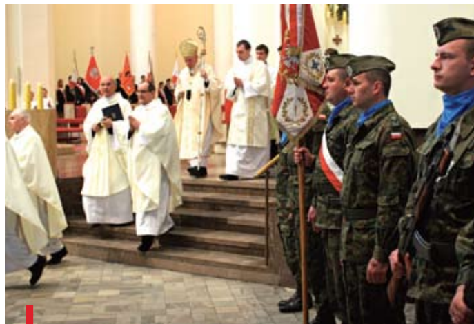
W uroczystości uczestniczyły kompanie reprezentacyjne wojska, policji, straży pożarnej, straży granicznej, a także harcerze, kombatancki i liczne poczty sztandarowe

KATOWICE. W ubiegłą niedzielę abp Damian Zimoń przewodniczył Mszy św. pontyfikalnej za Ojczyznę w katowickiej katedrze Chrystusa Króla. – Dzisiejszy kryzys gospodarczy jest wynikiem chciwości – mówił w homilii. – Zachłanność jest źródłem wszelkich przywar i wszelkiego zła, zarówno wśród pojedynczych osób, jak i w społeczeństwach. Przestrzegania moralności w życiu publicznym nie uregulujemy tylko za pomocą dobrych ustaw. Nawet najlepsze prawo nie rozwiąże wszystkich problemów, jeśli ludzie nie będą