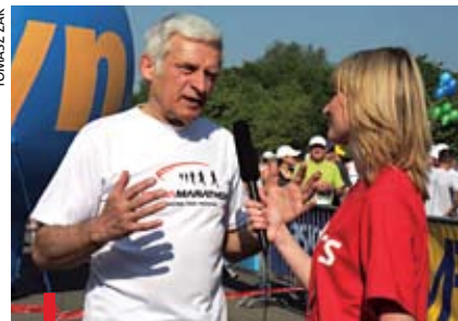
Jednym z uczestników maratonu był Jerzy Buzek

CHORZÓW. Punktualnie o godz. 9.00 spod Stadionu Śląskiego wyruszyli biegacze do pierwszego śląskiego maratonu Silesia Marathon 2009, który zorganizowany został w ramach obchodzonych Dni Województwa Śląskiego. Na starcie stanęło ponad 1,1 tys. zawodników, w tym pasjonaci biegania oraz ci, którzy dopiero stawiają pierwsze kroki w rywalizacji na tak długim dystansie. Część osób wybrała krótszą trasę, półmaratonu. Hasło przewodnie Silesia Marathon brzmiało: „Twój bieg, Twoje zwycięstwo.” Trasa wiodła m.in. alejami dwóch parków: katowickiej Doliny Trzech Stawów i chorzowskiego Parku Kultury i Wypoczynku oraz ulicami dzielnic Chorzowa, Katowic