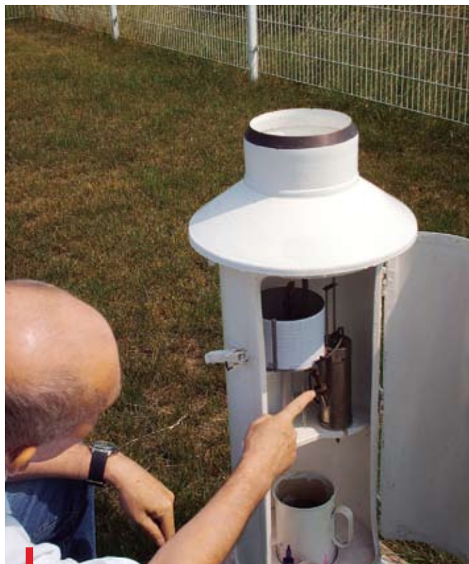
Pluviograf to urządzenie zapisujące ilość opadów

Obserwowane anomalie pogodowe to m.in. skutek ocieplania się klimatu. Stąd takie skrajności jak tegoroczny, bardzo wilgotny marzec i wyjątkowo suchy kwiecień. Dla porównania: w marcu tego roku w naszym regionie liczba dni deszczowych wynosiła od 20 do 26, a miesięczna suma opadów stanowiła miejscami 250 proc. normy dla marca. Tymczasem w kwietniu były zaledwie 3 dni z deszczem, i to w dodatku minimalnym. Sytuację pogarszają jeszcze wysokie temperatury.