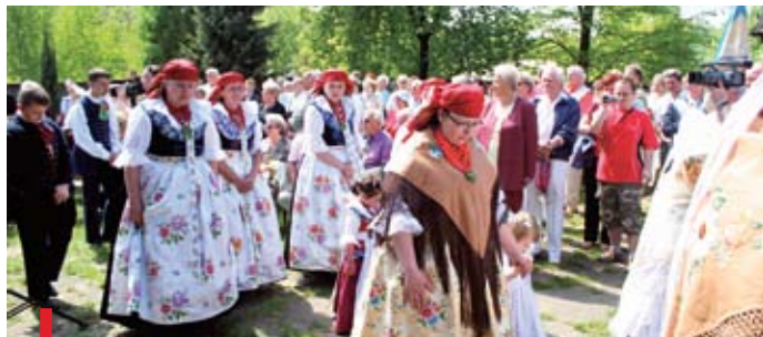
W procesji wokół kościoła wzięły udział m.in. kobiety ze Świętochłowic-Lipin w tradycyjnych śląskich strojach

CHORZÓW. Msza św. ku czci św. Józefa Robotnika rozpoczęła 1 maja Śląskie Gody, które w tym roku przebiegały pod hasłem „Śląski odpust w skansenie”. Eucharystii przewodniczył abp Damian Zimoń. Prosił, aby w życiu społecznym miłość pomagała podejmować słuszne decyzje, które nie będą dla ludzi krzywdzące. Homilię wygłosił ks. kanonik Paweł Buchta, kapelan Związku Górnośląskiego.