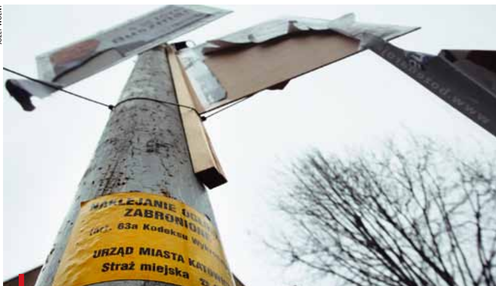
KATOWICE, 4 LISTOPADA 2010 R. Plakaty wyborcze na latarniach przy ul. Wita Stwosza, tuż obok redakcji „Gościa Niedzielnego”