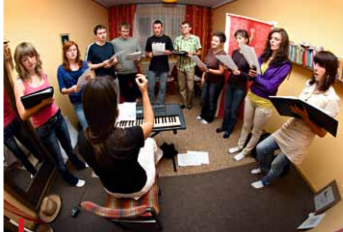
Próby chórzystów trwają nawet 6 godzin

W grudniu br. ukaże się ich płyta z kolędami. Potem przyjdzie czas na nagrania utworów dla Kopalni Soli w Bochni.