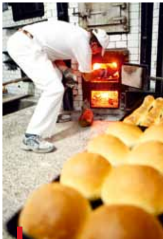
Branża spożywcza cieszy się wśród rzemieślników dużym powodzeniem