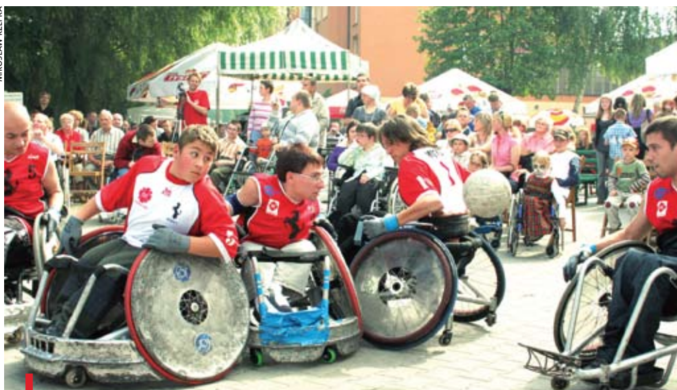
BOROWA WIEŚ. Działająca przy ośrodku „Miłosierdzie Boże” w Borowej Wsi drużyna rugby na wózkach „Jeźdźcy” zaprezentowała swe umiejętności. Pokaz przyciągnął bardzo wielu widzów

W niedzielę, 7 czerwca, na terenie Ośrodka dla Osób Niepełnosprawnych w Mikołowie-Borowej Wsi odbył się IX Dzień Otwartych Drzwi. Nosił on nazwę Otwarte Drzwi Otwartych Serc. Goście mogli odwiedzić Dom Pomocy Społecznej, Warsztat Terapii Zajęciowej, Zakład Aktywności Zawodowej. Mogli także zmierzyć ciśnienie oraz poziom cukru we krwi, skosztować domowych wypieków i zobaczyć występy zespołów artystycznych. W programie znalazły się m.in. gry i zabawy sportowe, pokaz rugby na wózkach, pokaz sprawności straży pożarnej, jazda konna oraz pokaz motocykli w wykonaniu grupy „Ostatni Mohikanie”. Imprezie towarzyszyła loteria fantowa, w której głównymi nagrodami były m.in.: netbook, rower górski i wycieczka do Medjugorie.