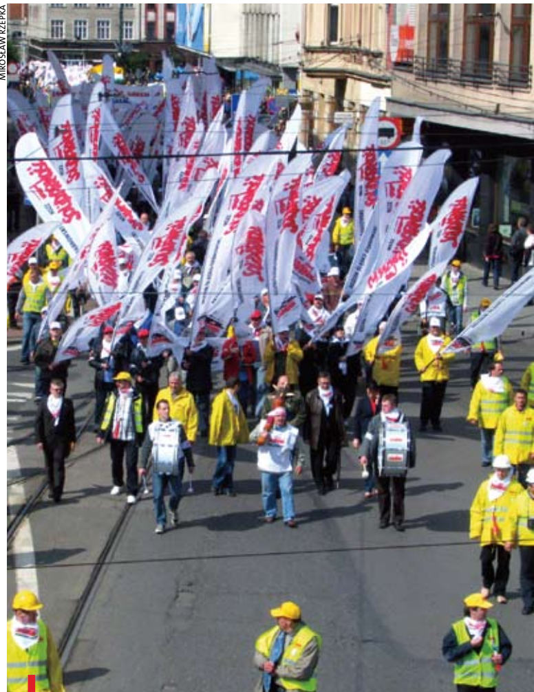
4 czerwca ulicami Katowic w manifestacji przeszło około 5 tys. związkowców

Szef regionalnej „S” przemawiał przed Śląskim Urzędem Wojewódzkim, gdzie manifestanci doszli w trwającym blisko godzinę marszu sprzed katowickiego Spodka. – 4 czerwca mamy prawo nie tylko cieszyć się z wolności, bo jest się z czego cieszyć, ale są problemy i mamy prawo je dzisiaj wykrzyczeć – ocenił. Jego zdaniem, władza usiłuje zawłaszczyć święto 4 czerwca.