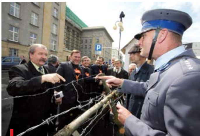
Uczestnicy happeningu mieli okazję przypomnieć sobie dawną granicę